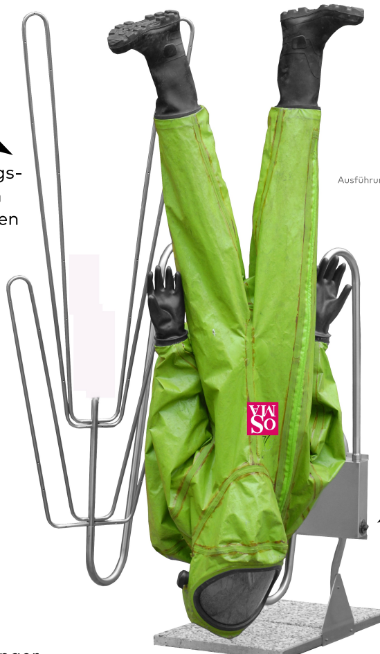
Ausführung HT-102-A als Stndgerät

Luft- und wasserdichte Längsverschraubung. Bis zu 20 cm variabel, daher für alle Größen von CSA geeignet.