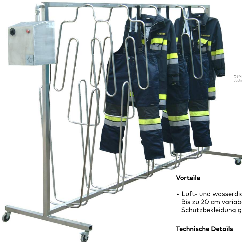
OSMA Fireman für jeweils 5 Jacken und Hosen Jackentrockner zu Hosentrockner längsversetzt